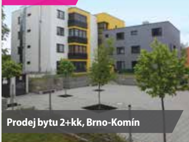
Prodej bytu 2+kk, Brno-Komín