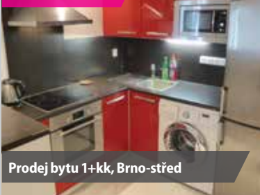
Prodej bytu 1+kk, Brno-střed