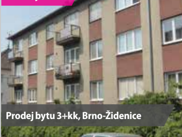
Prodej bytu 3+kk, Brno-Židenice