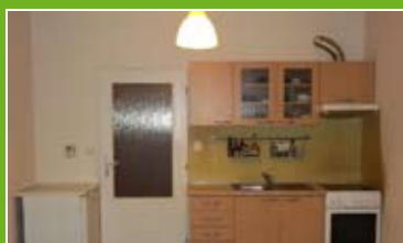
PRODEJ BYTU 1+KK, BRNO - KOMÁROV • cihlový byt 28,3 m 2 v OV • velmi dobrý stav, kolaudace v roce 2007 • pětipodlažní dům s výťahem N/RSB/12458/13 1 390 000 Kč