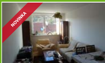
PRODEJ BYTU 2+1, BRNO - OSTOPOVICE • moderní slunný byt 63 m 2 vč. balkonu (OV) • prostorná šatna, sklep • 2 nekrýta parkovací stání v ceně N/RSB/12578/13 2 290 000 Kč