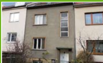
RODINNÝ DŮM, BRNO - ČERNÁ POLE • řadový RD s předzahrádkou a zahradou • možnost rozšíření o půdní vestavbu • dobrý stav s nutnou modernizací N/RSB/12511/13 4 750 000 Kč