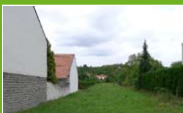
STAVEBNÍ POZEMEK, POZOŘICE • STP 1 007 m 2 • vydání územní rozhodnutí na stavbu polořadového RD • výborná dostupnost, všechny IS N/RSB/12293/13 1 500 000 Kč