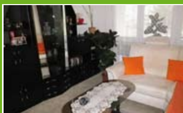
PRODEJ BYTU 2+KK, BRNO - ŽIDENICE • byt 44 m 2 v OV • neprůchozí pokoje, samostatná koupelna a WC, sklep • dům s výťahem po revitalizaci N/RSB/12454/13 1 550 000 Kč