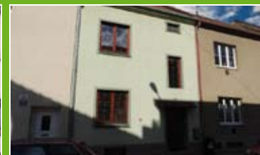
RODINNÝ DŮM, BRNO - ŽABOVŘESKY • řadový, podsklepený RD s dvorem • možnost rozšíření o půdní vestavbu • po kompletní rekonstrukci N/RSB/12442/13 5 250 000 Kč