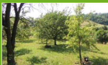
STP, BLANSKO - OLEŠNÁ • pozemek o výměře 979 m 2 • vhodný ke stavbě samostatně stojícího RD • lesnatá lokalita severně od Brna N/RSB/12135/13 890 000 Kč