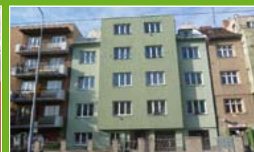
PRODEJ BYTU 2+1, BRNO - ČERNÁ POLE • cihlový byt 62 m 2 vč. balkonu • neprůchozí pokoje, zděný sklep • dům po revitalizaci • volný inhed • vč. terasy N/RSB/12482/13 1 990 000 Kč