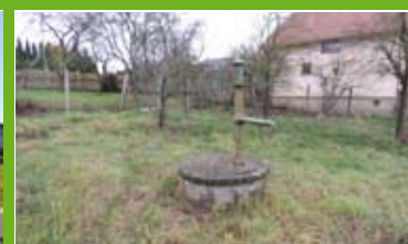
STAVEBNÍ POZEMEK, SVINOŠICE • pozemek (1 092 m 2 ) s menším RD k rekonstrukci (demolice) • STP je vhodný ke stavbě sam. stojícího RD N/RSB/12555/13 2 200 000 Kč