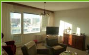
PŘEVOD BYTU 3+1, BRNO - BOHUNICE • DB 67,2 m 2 vč. zasklené lodžie • zděné jádro, sklep • dům s výťahem po celkové revitalizaci • nízké náklady N/RSB/12565/13 1 850 000 Kč