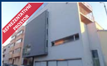
KANCELÁŘE V CENTRU BRNA • pronájem kancelářské jednotky na ul. Pellicova • celková výměra 28 m 2 • cihlová budova po rekonstrukci N/RSB/12514/13 14 000 Kč/měs. + en. a sl.