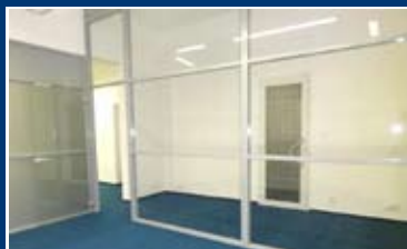
KANCELÁŘE, BRNO - STŘED • pronájem kancelářských prostor na pěší zóně • celková výměra 85 m 2 • rozděleno na 3 samostatné kanceláře N/RSB/12665/14 12 397 Kč/měs. + en. a sl.