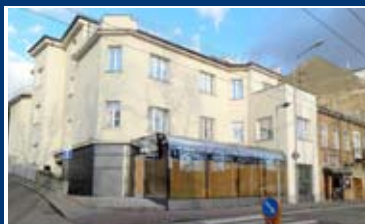
RESTAURACE, STARÉ BRNO • pronájem prostoru vhodného ke zřízení restaurace, kavárny nebo baru • cel. výměra 250 m 2 • po rekonstrukci N/RSB/12629/14 3 000 Kč/m 2 /rok + en. a sl.