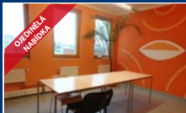
KANCELÁŘE, BRNO - STŘED • pronájem kanceláří v blízkosti centra Brna • samostatné patro v nové admin. budově • výměra 320 m 2 N/RSB/12674/14 56 000 Kč/měs. + en. a sl.