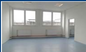
KANCELÁŘE, BRNO - ŘEČKOVICE • pronájem kanceláří ve výrobní/admin. objektu • uzavřený celek rozdělený na sam. kanceláře • výměra 358 m 2 N/RSB/12677/14 35 000 Kč/měs. + en. a sl.