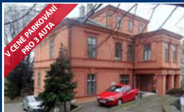
KANCELÁŘE, BRNO - ČERNÁ POLE • pronájem kancelářských prostor v přízemí admin. objektu • výměra 145 m 2 , rozděleno na 5 kancelář N/RSB/12681/14 28 800 Kč/měs. + en. a sl.