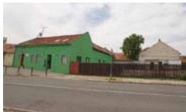
PODNIK. OBJEKT, BRNĚNSKÉ IVANOVICE • prodej objektu na hlavní ulici • celková užitná plocha budov 650 m 2 • stavební pozemek 537 m 2 N/RSB/10768/12 9 900 000 Kč