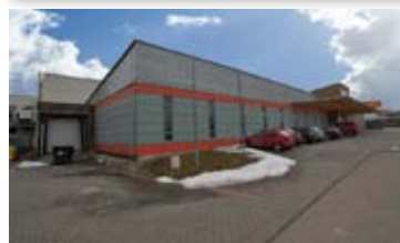
PRODEJNÍ VELKOSKLAD, BRNO - JIH • pronájem skladovacích/obch. prostor • užitná pl. cca 940 m 2 • v blízkosti výpadyky na Prahu, Bratislavu N/RSB/11461/13 1 500 Kč/m 2 /rok + en. a sl.