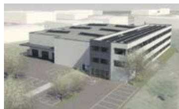
STAVEBNÍ POZEMEK, BRNO - SLATINA • prodej pozemku 6 499 m 2 u Čermovických teras • stav. povolení na halu 2 000 m 2 a admin. budovu 2 000 m 2 N/RSB/11442/13 2 600 Kč/m 2