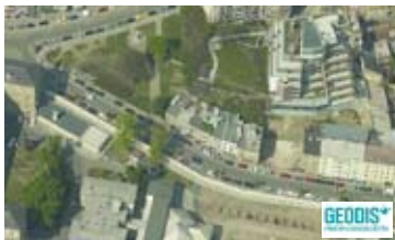
NÁJEMNÍ DŮM, STARÉ BRNO • prodej 3.NP domu se 3 byty • možnost rozšíření o přístavbu nebo nástavbu • UP 200 m 2 , pozemek 112 m 2 N/RSB/11303/13 8 300 000 Kč