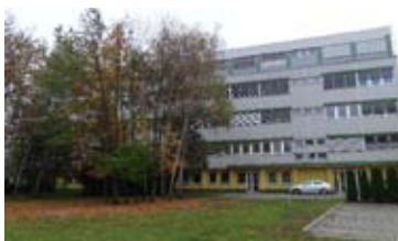
ADMIN. BUDOVA, BRNO - SEVER • prodej rekonstruovaného 5.NP objektu • možnost zachování nájemního vztahu po uzavření kupní smlouvy N/RSB/11019/12 53 900 000 Kč