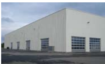
HALA, ŠLAPANICE U BRNA • pronájem skladovací haly cca 5 000 m 2 • možnost dělení od 1 000 m 2 • výška 10 m, manipulační plocha N/RSB/11449/13 900 Kč/m 2 /rok + en. a sl.