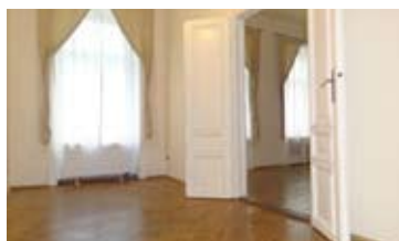
NEBYTOVÝ PROSTOR, BRNO - STŘED • prodej jednotky vhodné ke komerčním účelům nebo bydlení • celková výměra 100 m 2 • vlastní plynové topení N/RSB/11515/13 4 750 000 Kč