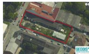
STAVEBNÍ POZEMEK, BRNO - TRNITÁ • prodej pozemku určeného ke komerčním účelům • celková výměra 1 900 m 2 - v blízkosti centra města N/RSB/11167/12 10 300 000 Kč