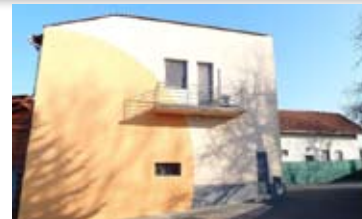
AREÁL, BRNO - CHRULICE • prodej admin. budovy se skladem v blízkosti dálnice D2 • UP 322 m 2 (sklady 126 m 2 , admin. a zázemí 196 m 2 ) N/RSB/10060/12 6 800 000 Kč