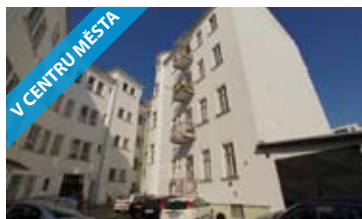
KOMERČNÍ OBJEKT, BRNO - STŘED • prodej souboru nemovitostí • admin. budova 2 474 m 2 , ND 1 155 m 2 , sklad, výroba 587 m 2 , pozemek 1 809 m 2 N/RSB/11524/13 65 000 000 Kč