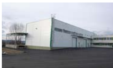
HALA, BRNO - JIH • pronájem nové haly v blízkosti D1 • UP 1 200 m 2 , kancelářské zázemí 166 m 2 , venkovní plocha 400 m 2 N/RSB/9803/12 1 300 Kč/m 2 /rok + en. a sl.