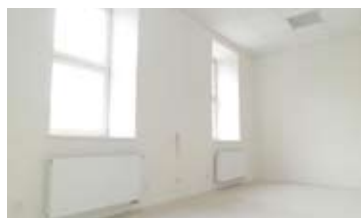
KANCELÁŘE, BRNO - STŘED • pronájem kancel. prostor na ulici Údolní • dva prostory o výměře 69 m 2 a 92 m 2 • vl. sociální zázemí N/RSB/11516/13 2 700 Kč/m 2 /rok