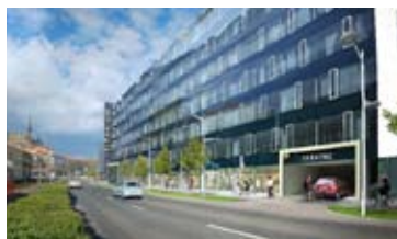
OBCHODNÍ PROSTOR, BRNO - STŘED • pronájem obchodního prostoru v centru města • celková výměra 86 m 2 • možnost členění dle potřeb nájemce N/RSB/11667/13 5 000 Kč/m 2 /rok