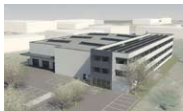
STAVEBNÍ POZEMEK, BRNO - SLATINA • prodej pozemku 6 499 m 2 u Černovických teras • stavební povolení na halu 2 000 m 2 a admin. budovu 2 000 m 2 N/RSB/11442/13 2 300 Kč/m 2