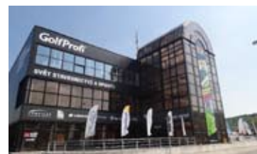
KANCELÁŘE V AREÁLU BVV • pronájem kancel. ve stavebním a interiérovém centru Nový Tuzex • výměra 135 m 2 • parkování vedle budovy N/RSB/11771/13 3 100 Kč/m 2 /rok