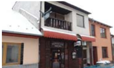
OBJEKT S RESTAURACÍ, BRNO - ŽIDENICE • prodej řadového objektu • zavedená restaurace (130 m 2 ), 3 byty (220 m 2 ) • výměra pozemku 152 m 2 N/RSB/11304/13 5 300 000 Kč