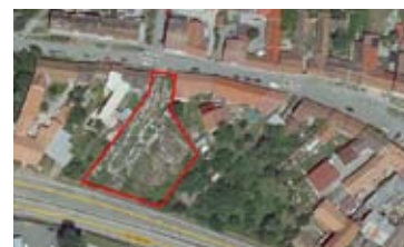
STP, BRNO - ČERNOVICE • prodej pozemku se stavebním povolením na adm. budovu s bydlením s UP 750 m 2 • výměra pozemku 2 560 m 2 N/RSB/11078/12 5 900 000 Kč