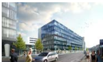
OBCHODNÍ PROSTOR, BRNO - STŘED • pronájem obch. prostor v novostavbě admin. objektu • centrální recepce, parkování • cel. výměra 516 m 2 N/RSB/11659/13 5 000 Kč/m 2 /rok