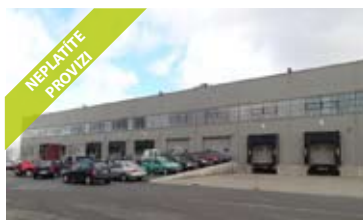
HALA, BRNO - ČERNOVICKÉ TERASY • pronájem nových „A“ skladových nebo výrobních hal • plochy od 2 000 m 2 - 30 000 m 2 • průmyslová zóna N/RSB/9972/12 cena od: 1 300 Kč/m 2 /rok