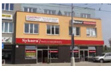
KANCELÁŘE, BRNO - KR. POLE • pronájem kanceláří v novostavbě polyfunkčního domu • výměra 154 m 2 • 3 kanceláře, vl. sociální zázemí N/RSB/11797/13 2 500 Kč/m 2 /rok