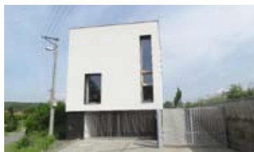
ADMIN. BUDOVY, BRNO - ŽEBETÍN • pronájem dvoupodlažní nízkooenergetické budovy • celková výměra 70 m 2 • vhodné pro sídlo firmy N/RSB/11769/13 18 900 Kč/měs.