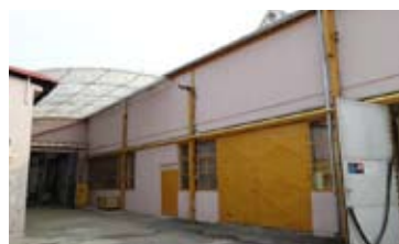
KOMERČNÍ OBJEKT, BRNO - TRNITÁ • prodej polyfunkčního areálu • sklady/výroba 1 080 m 2 , kanceláře 415 m 2 • pozemek celkem 1 800 m 2 N/RSB/10781/12 19 500 000 Kč