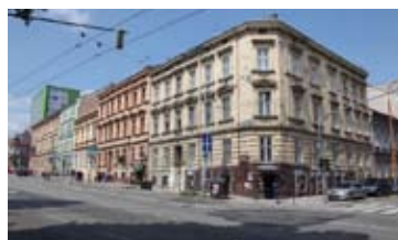
RESTAURACE, BRNO - KRÁLOVO POLE • prodej obchodního prostoru • nyní využíváno k provozu restaurace • užitná plocha 133 m 2 N/RSB/11702/13 3 290 000 Kč