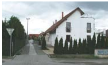
ADMINISTRATIVNÍ OBJEKT, BRNO - JIH • prodej novostavby admin. objektu v průmyslové zóně • užitná plocha cca 243 m 2 + půda, pozemek cca 480 m 2 N/RSB/4925/10 6 500 000 Kč