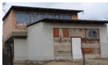
SÍDLA FIRMY, BRNO - JIH • prodej rozestavěné administrativní budovy s projektem na dostavbu • užitná pl. 270 m 2 , pozemek 700 m 2 N/RSB/9588/11 3 900 000 Kč