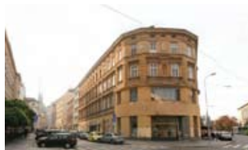
OBCHOD. PROSTORY, BRNO - STŘED • pronájem prostor o výměře 178 m 2 • obchod s velkými výlohami • jedinečná nabídka v centru města N/RSB/11588/13 55 000 Kč/měs.