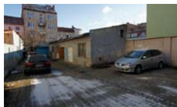
AREÁL, BRNO - STŘED • prodej menšího sídla firmy v centru Brna • užitná pl. (kancelář, dílna, sklad) 125 m 2 • pozemek 361 m 2 N/RSB/11378/13 4 500 000 Kč