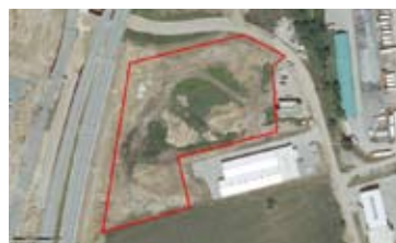
STAVEBNÍ POZEMEK, BRNO - MĚSTO • prodej STP v komerční zóně v jižní části Brna • možnost dělení od 5 000 m 2 • cel. výměra cca 13 000 m 2 N/RSB/10566/12 2 350 Kč/m 2