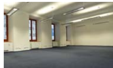
KANCELÁŘE, BRNO - STŘED • pronájem reprezentativních kancelářských prostor • možné úpravy dle požadované dispozice • celková výměra 510 m 2 N/RSB/990/09 2 050 Kč/m 2 /rok