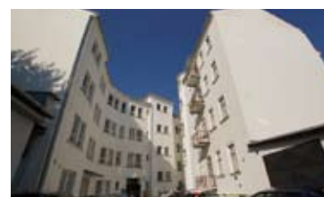
SOUBOR NEMOVITOSTÍ, BRNO - STŘED • prodej objektu - adm. budova 2 474 m 2 , nájemní dům 1 155 m 2 , adm. sklad, výroba 587 m 2 , pozemek 1 809 m 2 N/RSB/11523/13 65 000 000 Kč