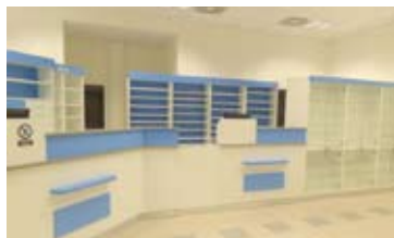
OBCHOD. PROSTOR, BRNO - STŘED • pronájem obch. prostoru ve Velkém Špálčuku • výměra 111 m 2 • vhodné pro lékárnu, zdravotnické potřeby N/RSB/11788/13 22 Euro/m 2 /měs.