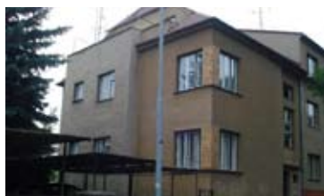
NÁJEMNÍ DŮM, STARÉ BRNO • prodej rohového nájemního domu poblíž centra • užitná pl. 317 m 2 , pozemek 520 m 2 • 4 byty, sklepy N/RSB/10062/12 13 900 000 Kč