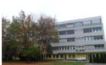
ADMIN. BUDOVA, BRNO - SEVER • prodej rekonstruovaného 5NP objektu • možnost zachování nájemního vztahu po uzavření kupní smlouvy N/RSB/11019/12 53 900 000 Kč