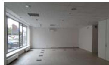
OBCHOD, BRNO - KRÁLOVO POLE • prodej obchodní jednotky na frekventovaném místě • celková výměra 100 m 2 • velké výlohy, parkování N/RSB/10691/13 4 600 000 Kč