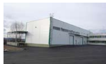
HALA, BRNO - JIH • pronájem nové haly v blízkosti D1 • UP 1 200 m 2 , kancelářské zázemí 166 m 2 , venkovní plocha 400 m 2 N/RSB/9803/12 1 300 Kč/m 2 /rok