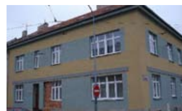
NÁJEMNÍ DŮM, BRNO - ŽIDENICE • prodej nájemního domu po kompletní rekonstrukci • 8 bytů s tržním nájemem • sklepní prostory, menší dvůr N/RSB/702/09 16 000 000 Kč