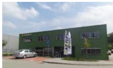
KANCELÁŘSKÉ PROSTORY, KUŘIM • pronájem kancelářských prostor v administrativní budově • výměra patra 288 m 2 • klimatizace, parkování N/RSB/11782/13 1 950 Kč/m 2 /rok