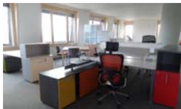
KANCELÁŘSKÉ PROSTORY, AZ TOWER • pronájem exkluzivních kanceláří od 80 m 2 do 250 m 2 , příp. celé patro 450 m 2 • celkem 272 park. stání N/RSB/11575/13 12 Euro/m 2 /měs.