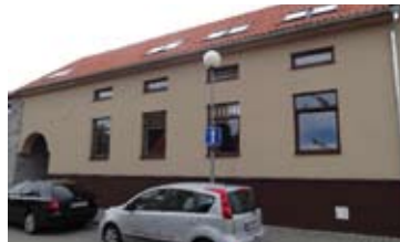
ADMINISTRATIVNÍ OBJEKT, BRNO - JIH • prodej dvoupodlažní budovy • kanceláře s možností vy- užití i pro bydlení • už. pl. 326 m 2 , pozemek 190 m 2 N/RSB/10642/12 7 700 000 Kč