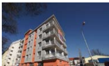
KANCELÁŘE, BRNO - ČERNOVICE • pronájem kanceláří v novém admin. objektu • flexibilní členění a velikosti volných ploch • klimatizováno N/RSB/11465/13 2 600 Kč/m 2 /rok