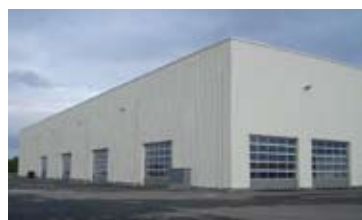
HALA, ŠLAPANICE U BRNA • pronájem skladovací haly cca 5 000 m 2 • možnost dělení od 1 000 m 2 • výška 10 m, manipulační plocha N/RSB/11449/13 900 Kč/m 2 /rok